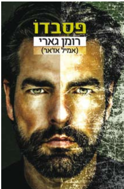
למעלה ספרו של רומן גארי שיצא לאור בימים אלה גז. "חייתי חודש במנזר ועברתי על 40 ארגזים מארכיון הסוכר"