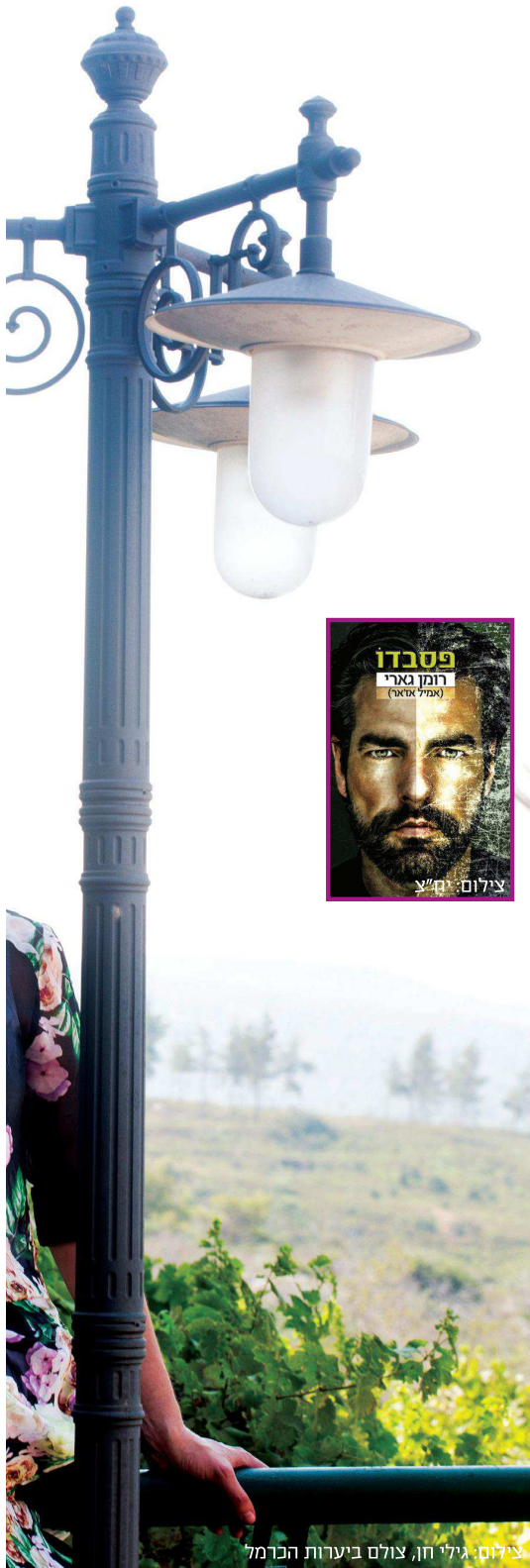
צולם ביערות הברמל